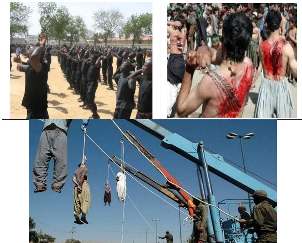
Hin nerîtên Şîe û bikaranînên rêjîma Wîlayetûlfeqîh